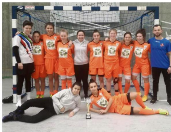
Piłkarki Iskry Brzezinka minimalnie lepszym bilansem bramkowym wyprzedziły Rysy z Bukowiny Tatrzańskiej i zajęły ostatecznie trzecie miejsce w halowych mistrzostwach Małopolski.