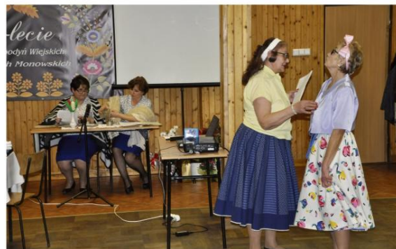
Historia KGW Stawy Monowskie według „Modraszki”