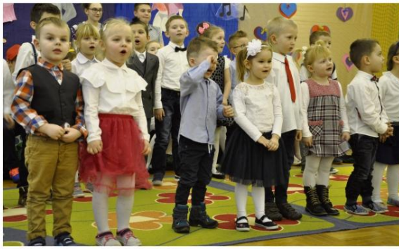
Przedшколяcy z Harmężali dali z siebie wszystko.

Wśród młodzieży przeprowadzono statystyczne badanie, pytając, kto jest największym autorytetem? Ku zaskoczeniu organizatorów tej ankiety uczniowie najczęściej wskazywali babcię i dziadka. A kiedy mieli uzasadnić odpowiedź, wyjaśniali, że babcia i dziadek mają mądrość, doświadczenie i dużo czasu.