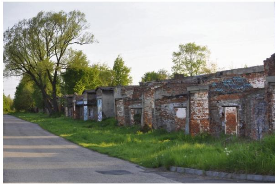
Ziemniaczarki - stan obecny.

kazując czas teraźniejszy, współczesność. Mogłoby też zapewnić obsługę odwiedzających Miejsce Pamięci. Myślę, że byłoby to ciekawym uzupełnieniem całego muzealnego kompleksu.