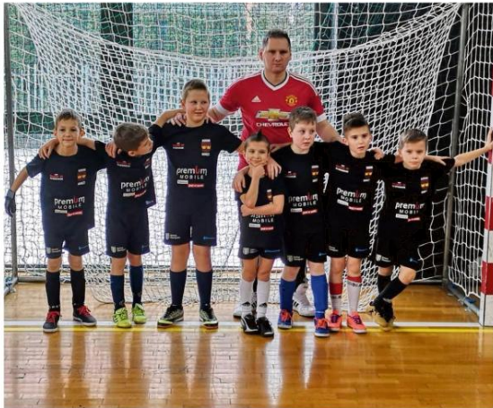
Żacy Korony Harmężę zwyciężyli w trzeciej edycji halowego turnieju o "Puchar Zimy".