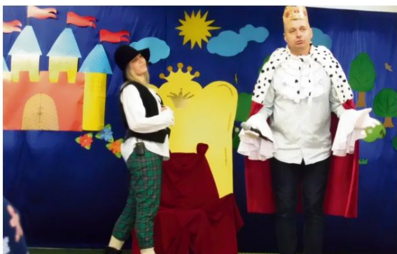
Przedszkole we Włosienicy - bajka w wykonaniu rodziców.

W tym gronie są osoby, których dzieci nie chodzą już do przedszkola. Mimo to zaangażują się w amatorskie warsztaty teatralne. Starają się tak ułożyć swoje