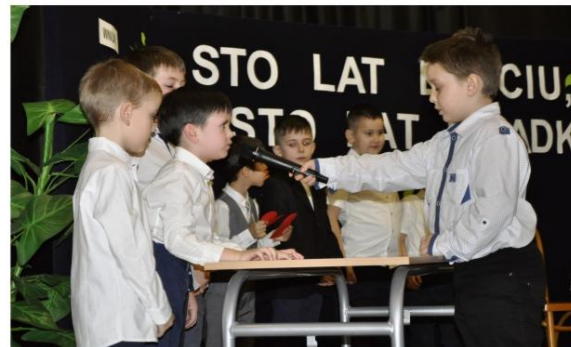
Teleturniej w Porębie Wielkiej.

pytania dzieci budziły świeże wspomnienia, zaś seniorzy, w których wcielił się uczniowie, wykazali się – tak jak w życiu – niespożytą cierpliwością.