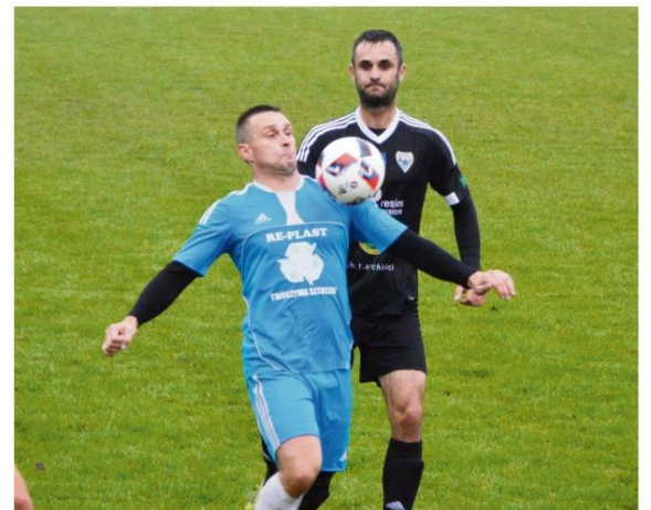
Beniaminek z Rajsko przystąpi do rundy wiosennej z ośmioma punktami przewagi nad goniącymi go zespołami z Nowej Wsi i Białki.