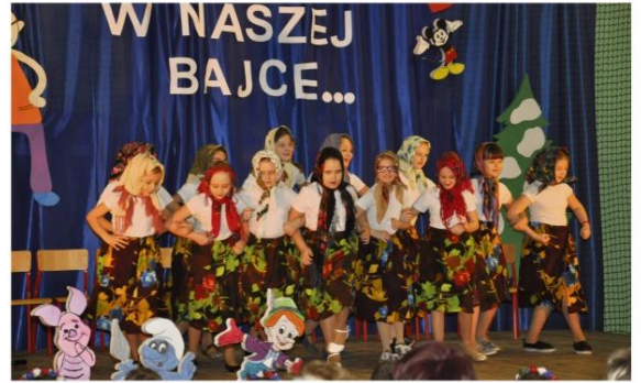
Szalone babcie w szkole we Włosienicy.

W przedstawieniu drugoklasistów głównymi postaciami byli bohaterowie święta – babcia i dziadek. Okazało się, że ich codzienne troski, myśli i radości są tak młode jak ich wnuki. Dociekliwe