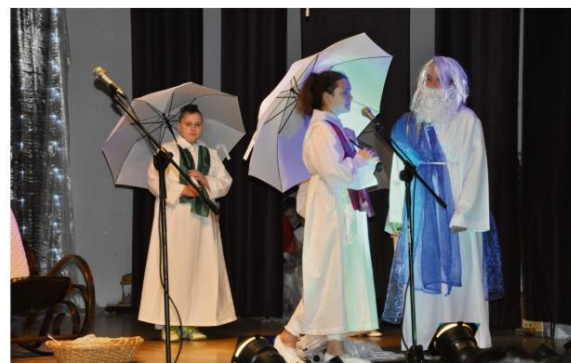
Widowisko „A z nieba posypią się anioły” w Groju.

Aniołowie pojawiają się zniecałkani i towarzyszą ludziom na ziemi w różnych życiowych sytuacjach. Widzimy je w scenie na lotnisku „Życie”, w domu, na ulicy, w podróży, w pracy. Pomagają